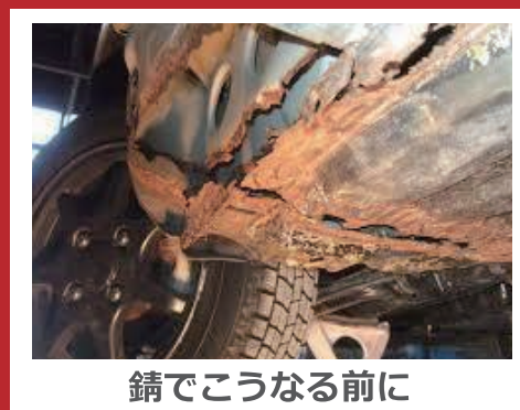
錆でこうなる前に