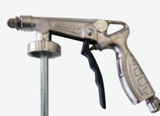
681-4221-2 ボディーアンダーシュツガン2 (缶口径40mm用)