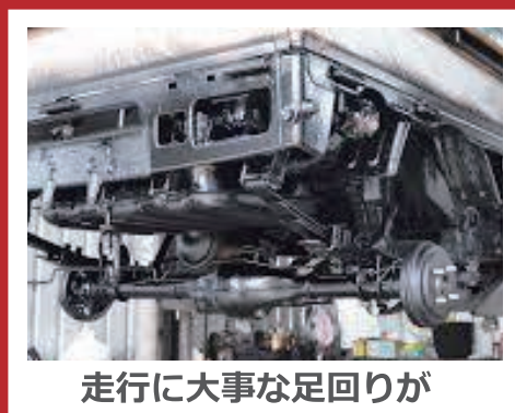
走行に大事な足回りが