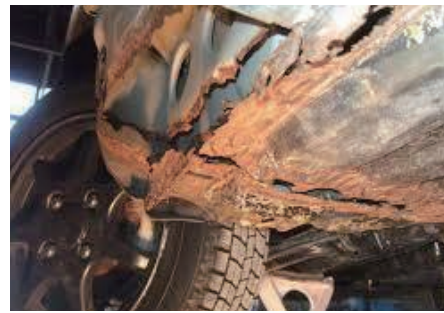
錆でこうなる前に