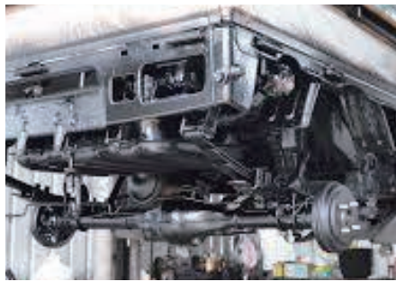
走行に大事な足回りが